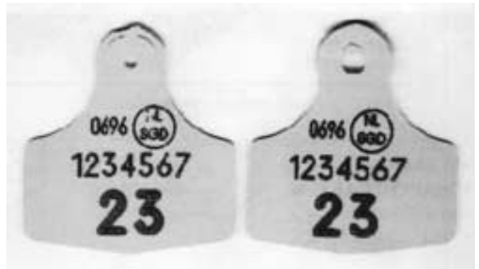
K12/K12 (met metalen punt).

ze aan te passen. Voorop staat natuurlijk het gebruik van geschikt materiaal. Een goed werkende tang die past bij het type oormerk en vervolgens ook goed wordt dichtgeknepen. Daarnaast is het belangrijk het oormerk op de juiste plaats in