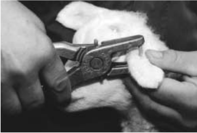
Het oormerk moet op de juiste plaats worden ingebracht. Dit om verwonding, slap hangen, ontsteking en verlies te voorkomen.