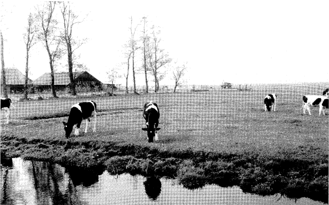
Het management op het bedrijf heeft grote invloed op de groei van het jongvee.

De chemische samenstelling van het ruwvoer is vermeld in tabel 2. Behalve de gemiddelde waar-