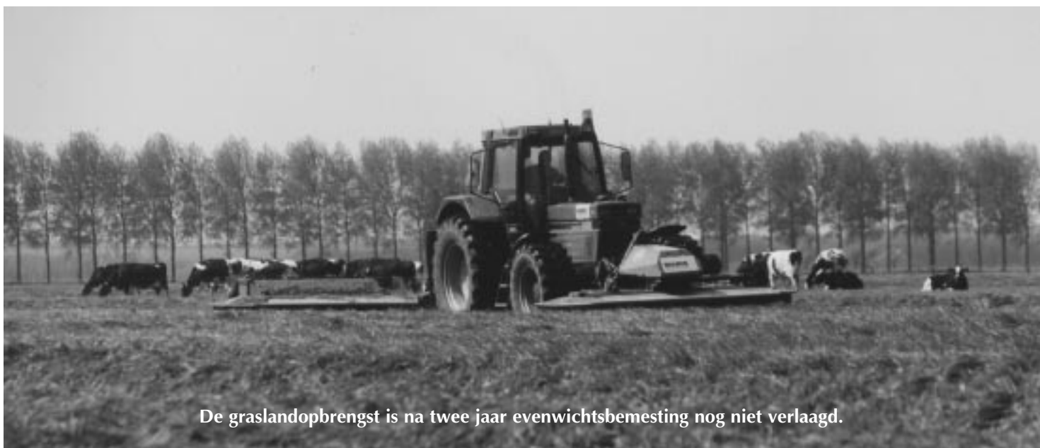
De graslandopbrengst is na twee jaar evenwichtsbemesting nog niet verlaagd.