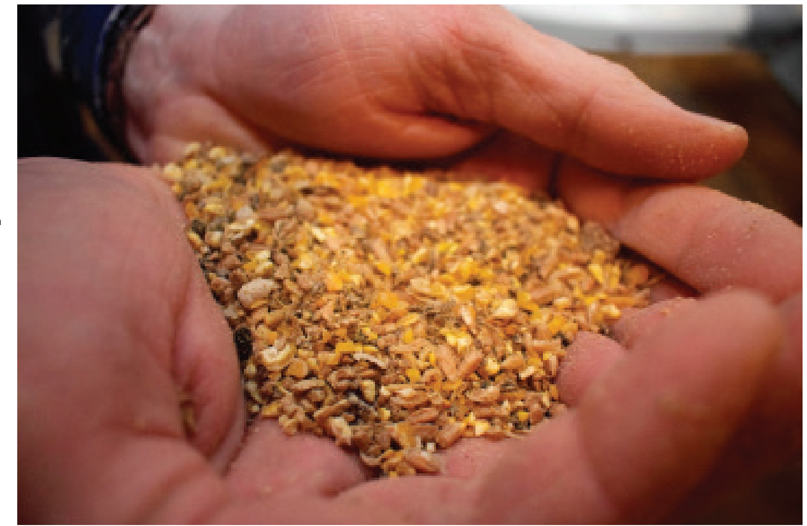
“Vanuit De Valk Wekerom zijn er aanpassingen aan de voersamenstelling gedaan om de voeropname te bevorderen en dat heeft goed uitgepakt”

Van de Haar gaat dan ook regelmatig de stal in om zijn koppel hennen te analyseren op gezondheid en