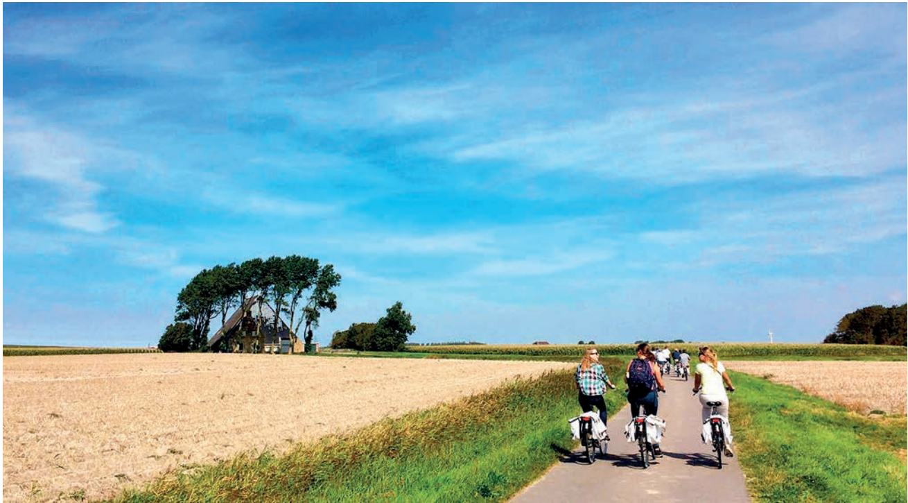
Afbeelding 1: Masterplan 'Gouden land'. Visie op de toekomst van de Marneslenk en omgeving.

een nieuw 'dijklandschap' met hogere recreatieve en ecologische waarden, die binnen en buiten met elkaar verbindt. Wandelroutes vanuit de dorpen – op initiatief van de dorpelingen – zouden op deze eigentijdse innovatie kunnen aanhaken. Vormen van Land Art zouden het nieuwe dijklandschap kunnen accentueren. Kortom, ideeën te over, maar hoe zorg je ervoor dat ideeën ook echt landen in het gebied en daadwerkelijk projecten worden, waarbij de energie niet vervliegt en uiteindelijk in de Waddenzee verdwijnt?