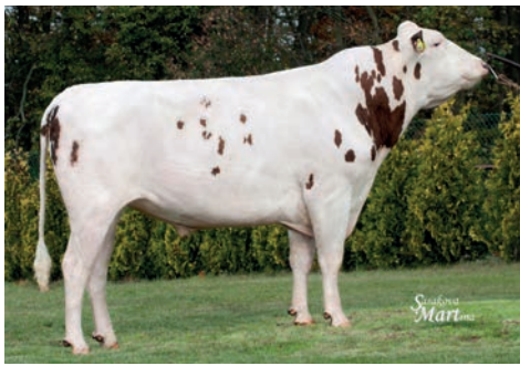
Horst Libero (Liza 173 x Deluxe P)