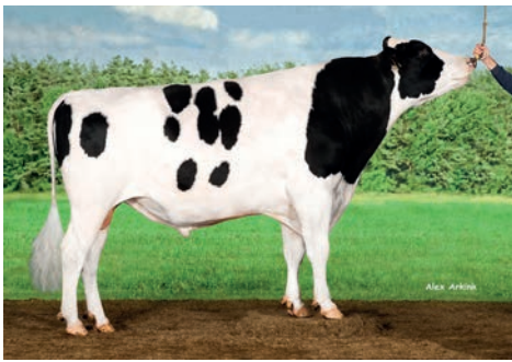
Horst Allard rf (Liza 173 x Hunter)