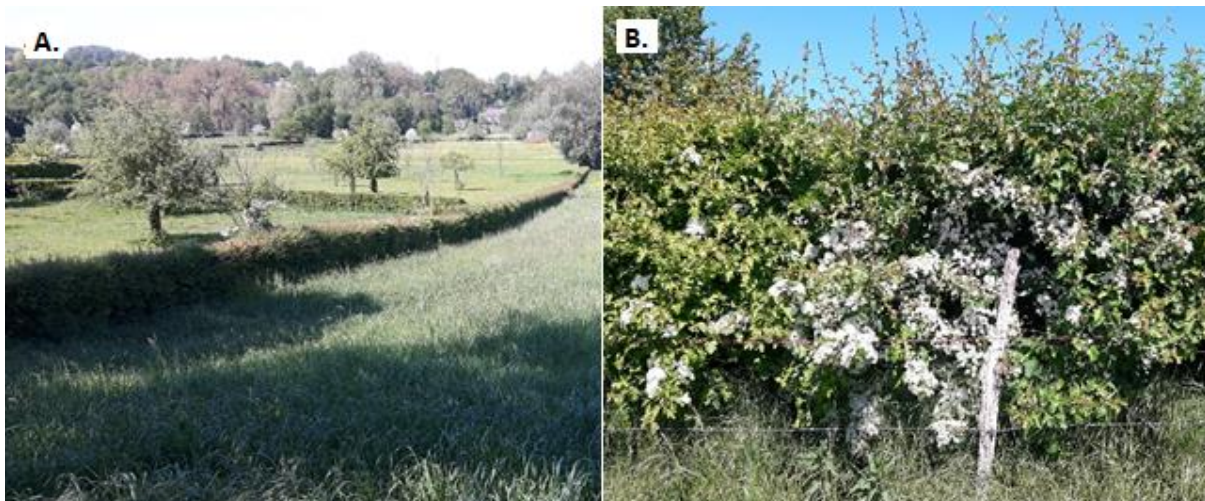
Figuur 1: Een voorbeeld van een scheerheg (A) en een struweelheg (B) in het Zuid-Limburgse Landschap. In situatie B krijgt de haag de kans om in bloei te komen, en bijen van voedsel te voorzien.