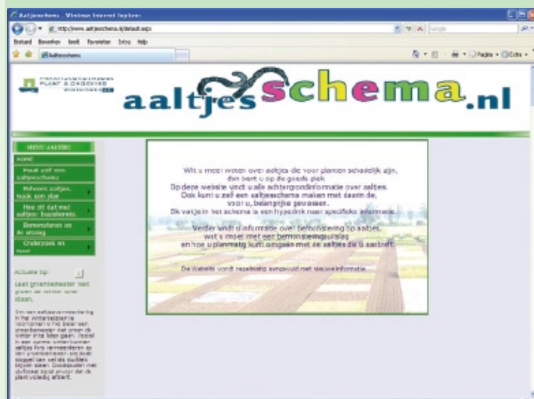
Definitief ontwerp van de website www.aaltjesschema.nl .

Doel van het onderzoek is het ontwikkelen en uitbreiden van software die de kennisoverdracht bewerkstelligt. Er wordt zowel gewerkt aan het beschikbaar stellen van een kwalitatief kennissysteem via het internet en een kwantitatief kennissysteem, een Beslissing Ondersteunend Systeem (BOS) NemaDecide met schadeverwachting en populatieontwikkeling in de tijd. De bemonsteringsuitslagen worden via een webservice opgehaald bij de monsternemer en kunnen met behulp van geografische informatie ruimtelijk worden weergegeven. Beide systemen helpen de teler bij het beheersen van zijn aaltjesprobleem.