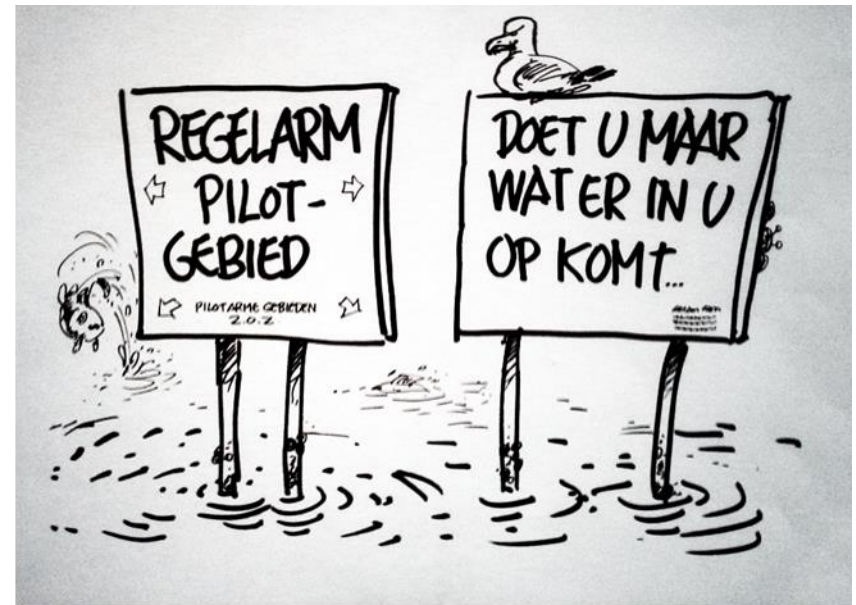
Cartoon: Maarten Wolterink www.mwcartoons.nl