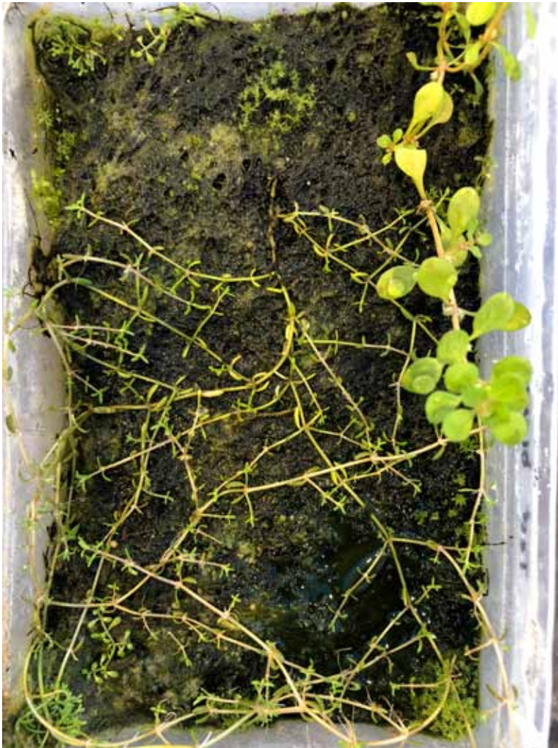
Foto 2: De ontwikkeling van stukjes watercrassula na heet-waterbehandeling is veel sneller wanneer de afgestorven plantenresten achterblijven (links) dan wanneer het dode materiaal wordt verwijderd (rechts).

Plantengroei op de met heet water behandelde afgestorven watercrassula was veel groter dan op de bodems waar ook de plantenresten waren verwijderd. Drie soorten in het bijzonder profiteerden van de dode watercrassula : knikmos ( Bryum spec. ), draadalg en water-vorkje ( Riccia spec. ). Deze soorten zijn allen kenmerkend voor voedselrijke bodems. De totale bedekking van soorten met een voorkeur voor hoge beschikbaarheid van voedingsstoffen was bijna drie keer zo groot op bodems waar de afgestorven planten waren blijven lig-