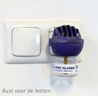
Rust voor de katten

HANDIGE VLOER De vloeren zijn overal van epoxy-troffel met antislip. Bas: “Dat is ook als het nat wordt niet glad. Nadat je de vloer hebt drooggetrokken, kunnen de honden eroverheen lopen en zelfs rennen zonder uit te glijden. In de gangpaden heb ik vloerverwarming laten aanbrengen, zodat de vloeren daar heel snel droog zijn.”