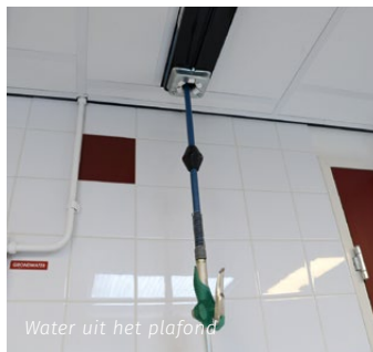
Water uit het plafond