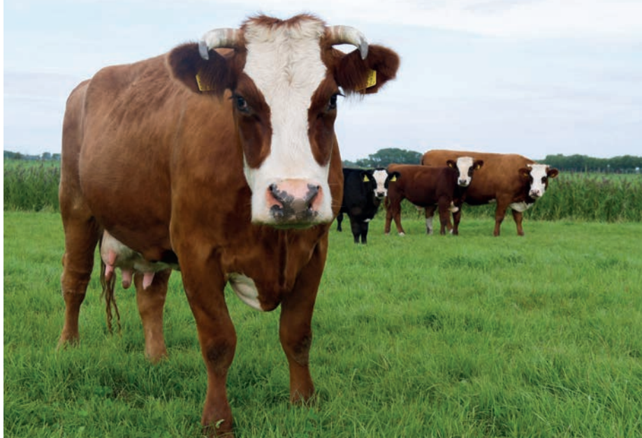
Rode Groninger blaarkop van de Eytemaheert

geweest. We gebruiken geen kunstmest, geen preventieve antibiotica en geen gif. Volume? Prima, als er maar balans is. Het is een kwestie van willen, van duurzaam willen zijn. Er is vraag naar goed vlees, straks hebben we 180 hectare met 130