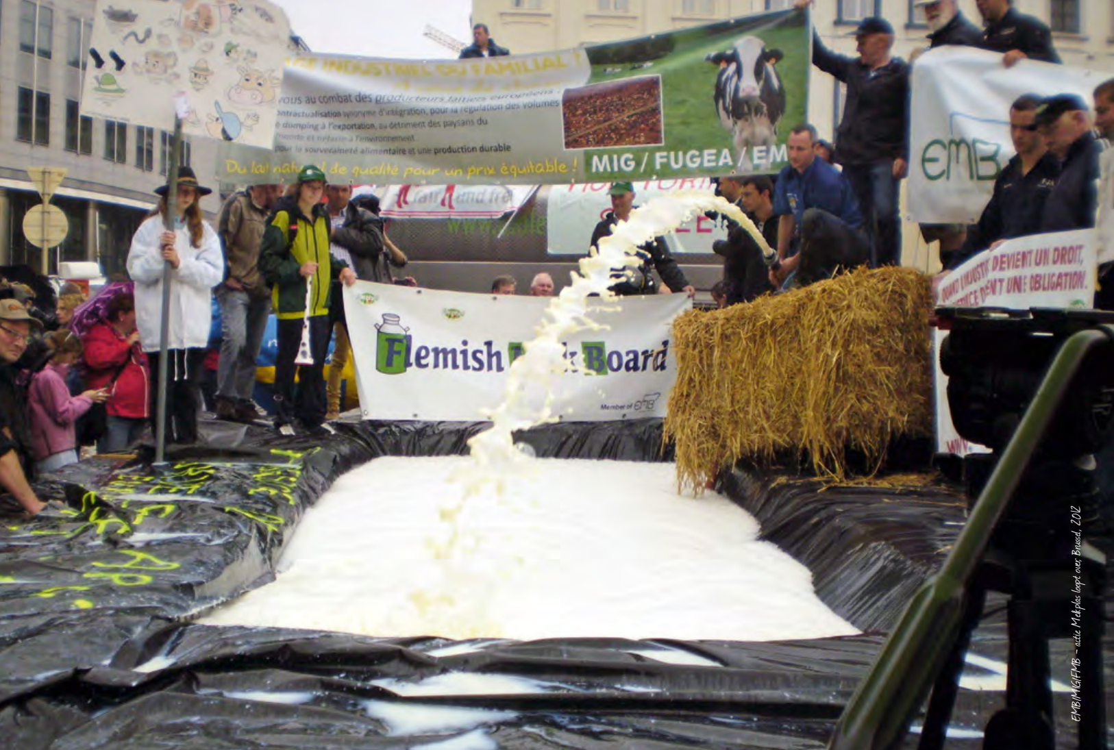
EMB/Mel/FMB - actie Melkplak loopt over Brussel, 2012

uit derde landen. Er was dus geen sprake van interventie maar van grensbescherming, zoals bij zware marktordeningen.