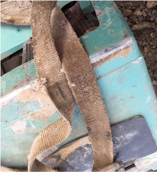
Inspecteer een hijsband voor gebruik. Deze hijsband is niet geschikt.