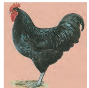
Foto uit de Duits/Europese standaard waarbij duidelijk opvalt dat met name het lichaam van de hen niet symmetrisch is t.o.v. de loopbenen, iets dat volgens Nederlandse begrippen beslist ongewenst is. Vreemd genoeg komt dat vaker voor in die standaard bij rassen waarbij dat zeker niet gewenst is. (Duitse/EE standaard)