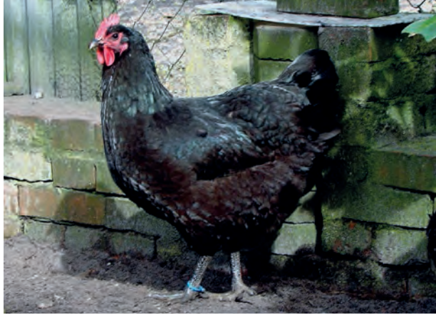
Deze zwarte hen toont een mooie lange rug, maar staat iets voorover, waardoor de rug iets op lijkt te lopen. (Rick Roelfsema)

de grootte en bevezeling gelijkmatig ontwikkelen. Dit maakt het moeilijk om de dieren op type te beoordelen, wanneer ze nog niet volgroeid zijn en dus hun naam als 'gigant' nog niet waarmaken. Het spreekt voor zich dat de dieren, totdat zij daadwerkelijk volgroeid zijn, ook veel voer eten. De kammen zijn wel al vanaf een week of 6 tot 10 te beoordelen. Houd er dan wel rekening mee dat u niet gauw zulke mooie kammen zult tegenkomen als gewoonlijk bij Australorps, al moet dat wel het streven zijn! Ook de beenkleur en kleur van de voetzolen zijn al vroeg te beoordelen.