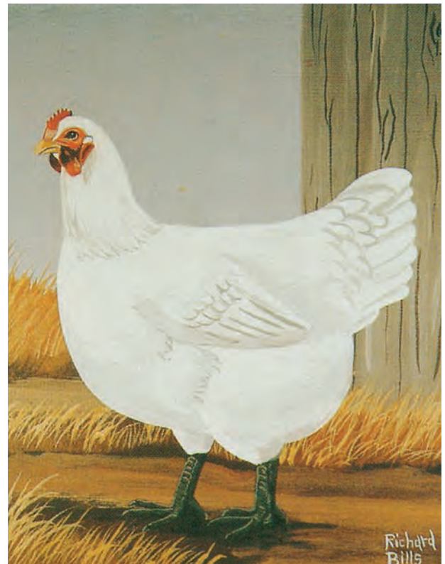
Fraaie forse witte hen volgens de huidige Amerikaanse standaard. De hals is naar verhouding tot het lichaam wat aan de korte kant en de mooie lange rug mag iets meer aflopen. Let ook op de gewenste tint van de donkerwilgengroene loopbenen. (Am. Standard of Perfection)

Dan komen we bij de laatste kleurslag, gezoomd blauw. Het gezegde "Blauw is geen kleur maar een toestand," is hier ook zeker van toepassing. De kunst is zo gelijkmatig mogelijk middenkleurig leiblaauwe dieren te fokken, zonder kleurspatten en met een blauwe zoming in de borst van de hanen en alle lichaamsveren bij de hennen. De sierbevedering van de hanen en de halsbevedering van de hennen is wat donkerder dan de rest van de bevedering. Bij de hanen zien we vaak dat hals, rug en zadel donkerder zijn zonder duidelijk zichtbare zoming en het zijn met name de borst en flanken waar de helderblauwe veren duidelijk omzoomd zijn. Uitdaging bij deze kleurslag is vooral het behoud