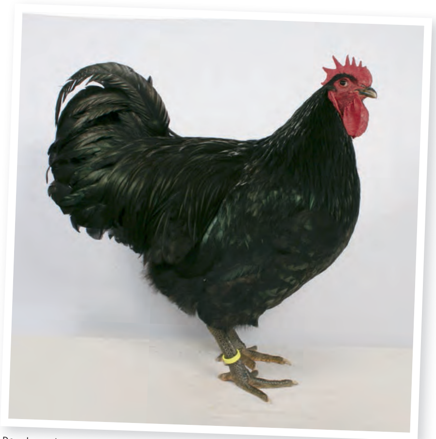
Deze Jersey haan moet iets langer van lichaam, de borst moet iets dieper en niet zo ver naar voren gedragen worden. De dijen moeten beter zichtbaar zijn voor het perfecte type. De kam is wat aan de kleine kant en is niet in evenwicht met de kinlellen.

Hopelijk heb ik u niet afgeschrikt door alle 'uitdagingen' die aan dit ras verbonden zijn, want ieder ras heeft zijn plus- en minpunten. Over het algemeen doen de Jerseys het in ons land niet slecht op tentoonstellingen. Keurmeesters kennen de stand van het ras en weten dat ze met wat tact gekeurd moet worden, waarbij het belangrijk is de positieve punten duidelijk naar voren te laten komen. Het zou zeker een opsteker zijn als fokkers gaan samenwerken en weer een speciaalclub zouden opzetten. Zo wordt het makkelijker om samen de kwaliteit op een hoger peil te brengen en het ras te promoten. Hoe mooi zou het zijn als we de komende jaren steeds vaker de Jerseys tegenkomen op onze tentoonstellingen! ●