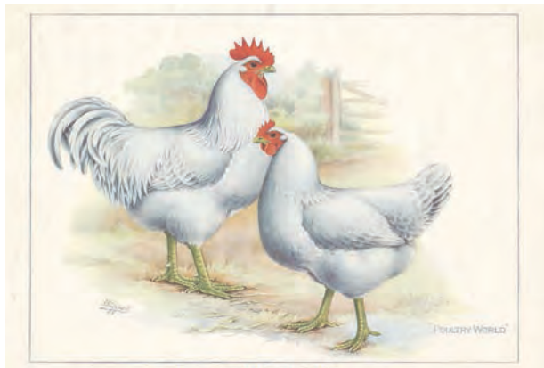
Een paar witte Engelse Jerseys volgens Wipsett. De hen moet de staart iets meer spreiden en de staart van de haan mag iets voller. Dit en de wat hoge stelling is vaak typisch voor Engelse dieren.