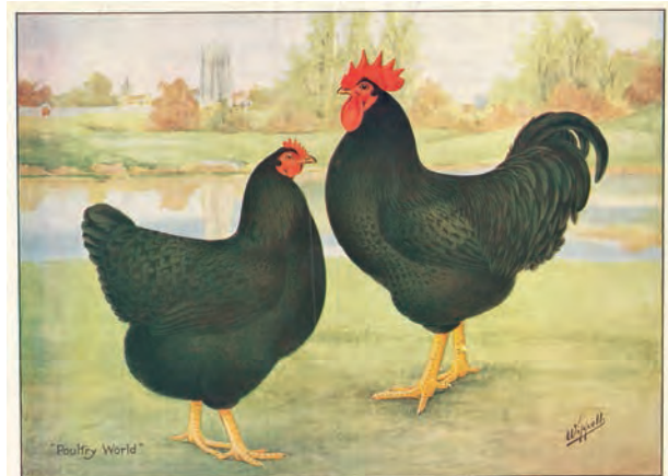
Jersey Giants van Wipsett. Niet het type dat we willen, ook de gele loopbenen niet. Een aardig zoekplaatje naar de 10 verschillen t.o.v. ons ideaalbeeld. Let ook op de oogkleur.