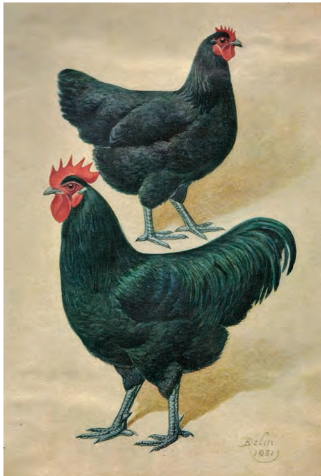
Tekening van de vermaarde Belgische tekenaar Delin uit 1951. Met een wat vlakkere en iets meer aflopende rug en wat hoger gedragen staart zouden deze hoenders helemaal aan onze standaard voldoen.