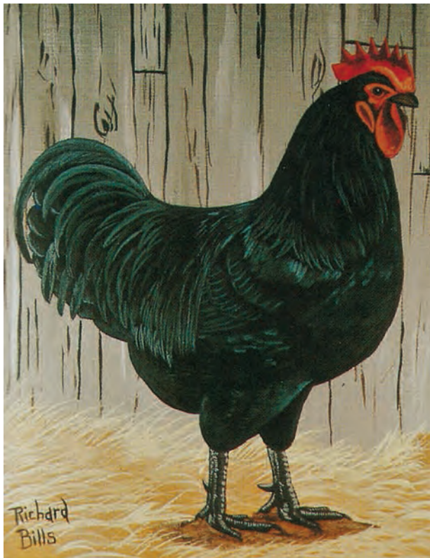
De huidige Amerikaanse standaardtekening van een zwarte Jersey haan. Vreemd dat die standaard nu een wat kortere rug aangeeft t.o.v. het oorspronkelijke ideaalbeeld. (Am. Standard of Perfection)

Er wordt nogal eens gezegd dat de fok met enkelkleurige dieren makkelijk is, omdat er geen 'tekening' is waar je rekening mee moet houden. Dit klopt echter niet, want wanneer u enkelkleurige dieren showt, waarbij de tekening geen rol speelt, zullen keurmeesters strenger zijn op de overige raskenmerken. Hier ligt ook de uitdaging. Door de geringe hoeveelheid fokkers is er slechts een kleine genenpoel, wat de stand van het ras zeker niet ten goede komt. De kleur van de bevedering is pas in een later stadium goed te beoordelen. Zwarte dieren dienen een mooie kevergroene glans te tonen. Deze verschijnt pas echt goed