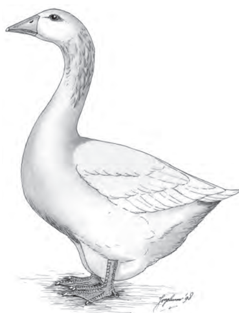
De huidige standaardtekening.