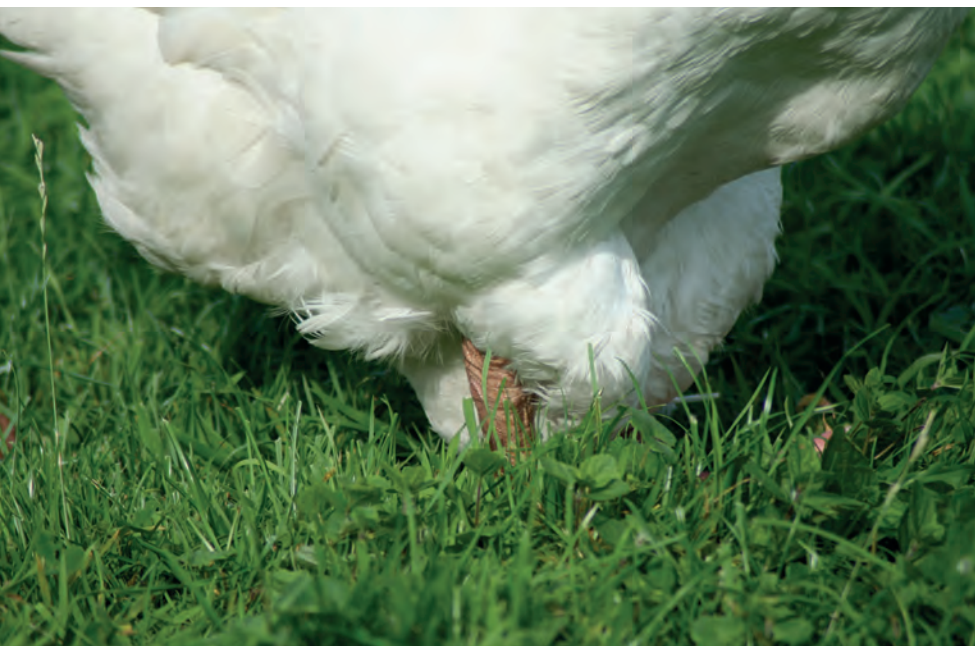
De buikwam is groot en diep, van voren open en van achteren gesloten.

Een aantal enthousiaste Duitse fokkers legden de basis voor het nieuwe type Emdener gans die ook wat zwaarder in gewicht was dan in het verleden, maar niet het gewicht had van het Engelse type. Zij brachten vrij uniforme dieren en wisten anderen te enthousiasmeren om ook deze dieren te fokken. Dit bracht een flinke groei tot stand die zijn hoogtepunt vond in 1939. Toen gooide de Tweede