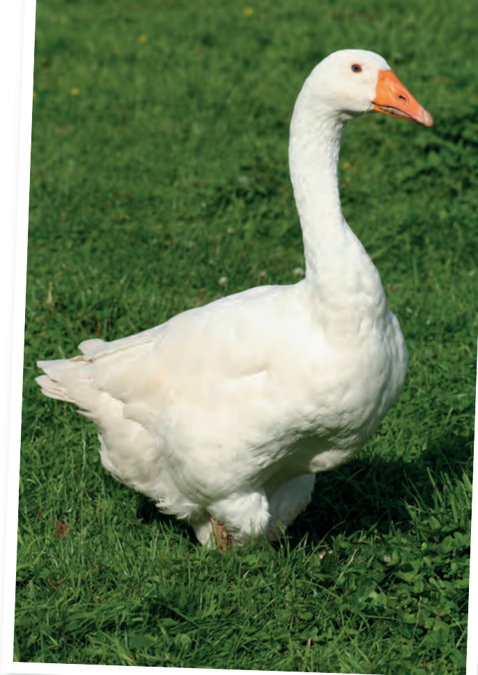
Het zijn erg statige ganzen.

En ze behoren goed breed te zijn, zodat de lange vleugels niet kruisen. Dit laatste komt nogal eens voor en geeft aan dat de dieren te smal van bouw zijn. De kop is enigszins vlak waardoor de middellange snavel vloeiend overgaat in de kop. De snavelkleur is oranje. De ogen zijn lichtblauw met smalle oranje oogranden. De rug is aflopend en weinig gewelfd en de staart wordt horizontaal gedragen. De borst is goed gerond en de buik is voorzien van een goed ontwikkelde dubbele buikwam die van achteren gesloten is. Deze buikwam mag de grond niet raken. Dikwijls zijn de poten te kort als de buikwam wel de grond raakt. De poten