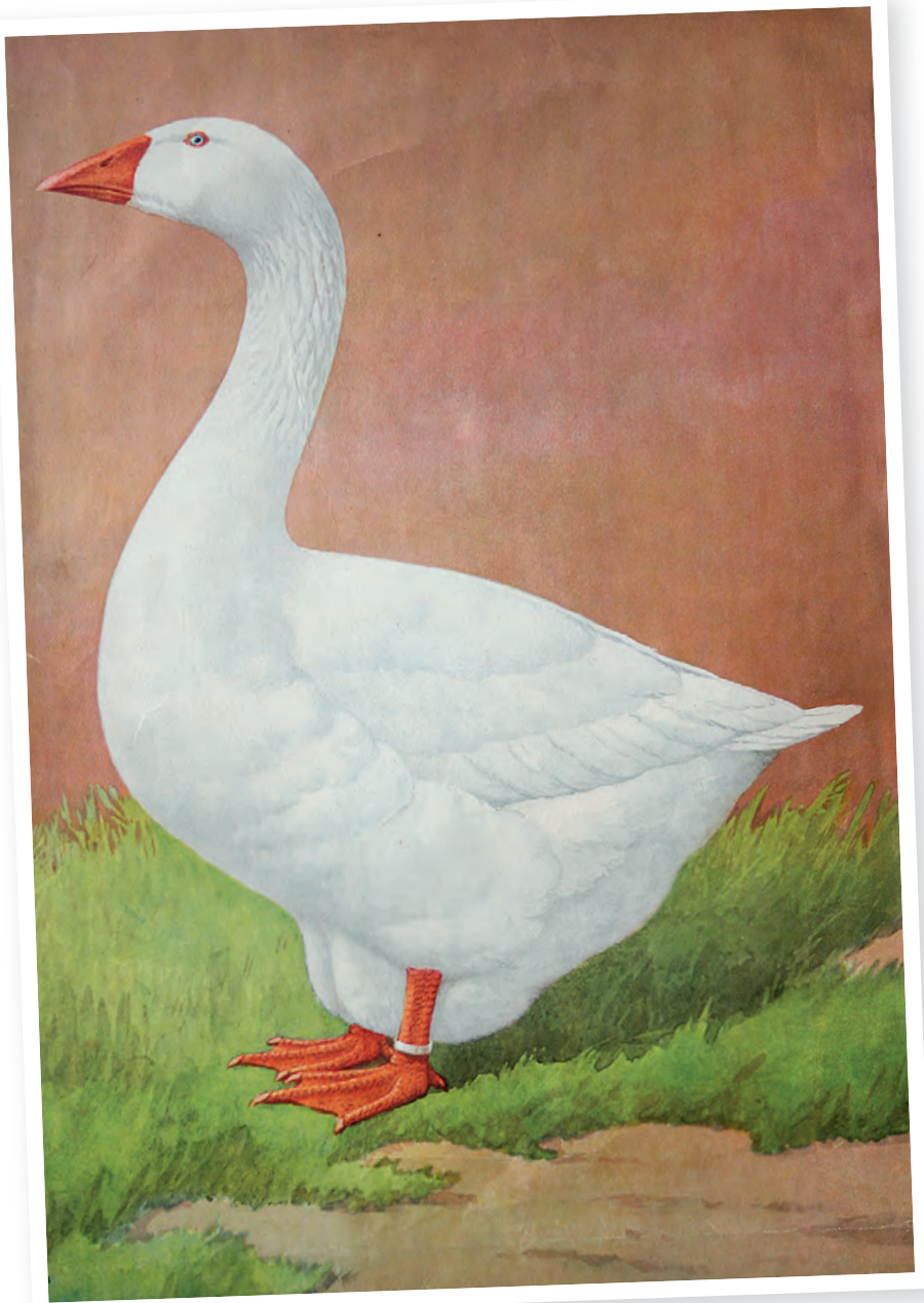
Een schilderij uit vervlogen tijden.