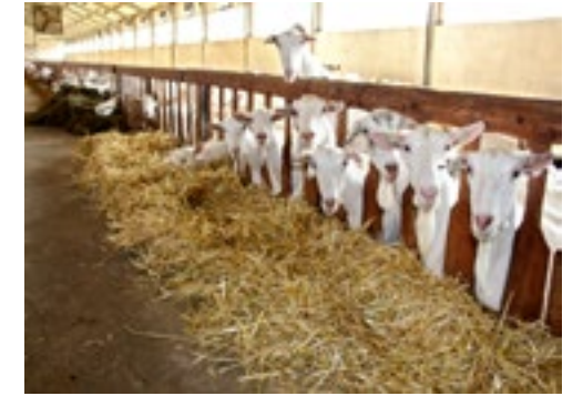
Familie Selman voert de geiten stro bij, waar ze goed van eten.

‘Mijn ouders spoorden mij te weinig aan om boer te worden’