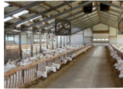
De stal is licht en heeft een houten voerhek.