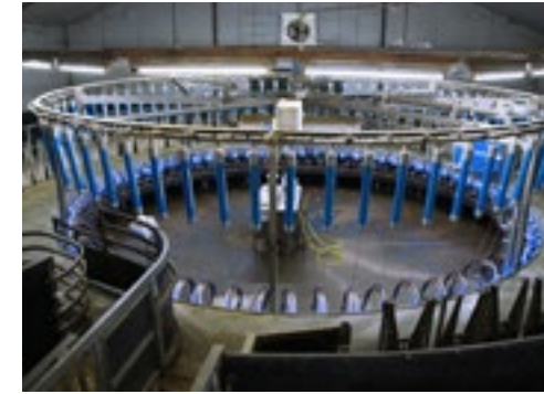
De 72-stands carousel dateert uit 2002 en is in 2016 voorzien van nieuwe melkstellen.