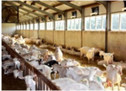
Er zijn drie productiegroepen: hoogproductieve geiten, jaarlingen en duurmelkers.