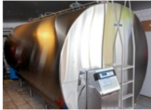
De nieuwe melktank heeft een capaciteit van ongeveer 15.000 liter.