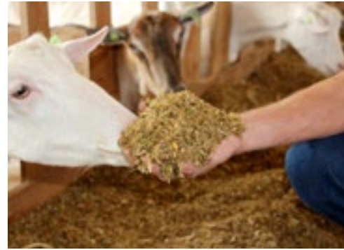
Het rantsoen bestaat voor ongeveer 50 procent uit eigen ruwvoer (gras en maïs).