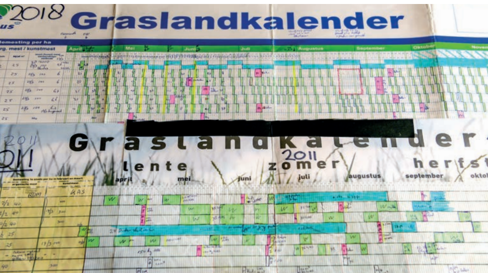
▲ De graslandkalender in 2011 (onder) en in 2018 (boven): van chaos naar Nieuw Nederlands Weiden

teit, ook de bijvoeding naast de weidegang. Bij warme dagen zie je bijvoorbeeld direct de herkauwactiviteit naar beneden gaan, omdat koeien in verhouding meer krachtvoer en minder ruwvoer gaan opnemen. We zetten dan direct extra smakelijk structuurgras voor het voerhek en dat werkt', vertelt Hielke. 'Door te sturen op herkauwactiviteit hebben we de koeien super door de warme zomer gekregen.'