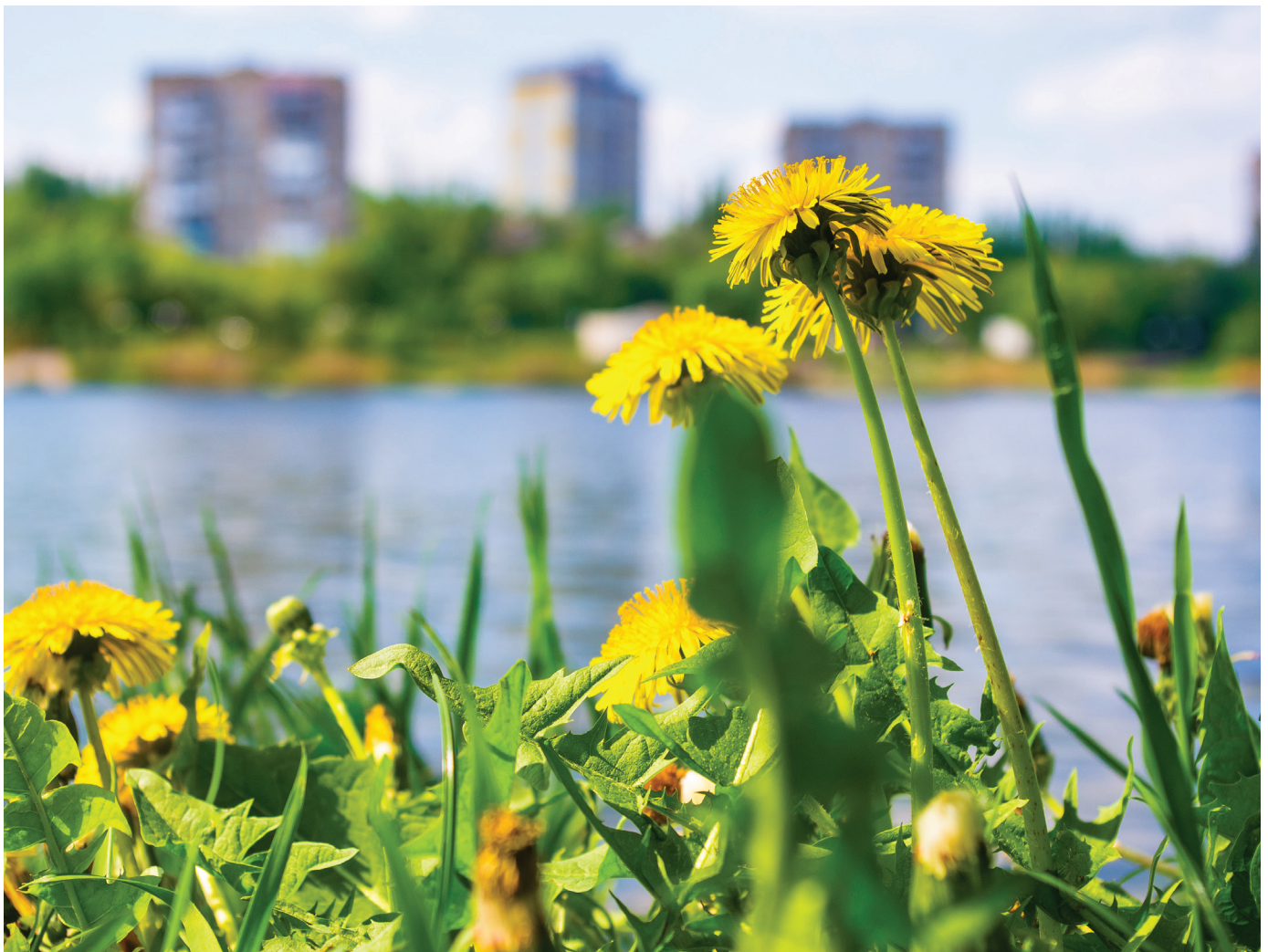
Wonen, werken en ontspannen raken steeds meer verweven met de natuur

Daarnaast is er weinig aandacht voor sociaaleconomische vraagstukken die met vermaatschappelijking van natuur samenhangen en staat de wenselijkheid van deze vermaatschappelijking niet ter discussie. Er is in weinig van de geanalyseerde studies aandacht voor eventuele negatieve aspecten van vermaatschappelijking, zoals mogelijke sociale en/of ruimtelijke ongelijkheden en een eerlijke verdeling van kosten en baten. Dit terwijl er in het door ons geïnventariseerde onderzoek wel een aantal indicaties zijn dat niet iedereen even goed meekomt bij bepaalde vormen van vermaatschappelijking. Zo leiden verschillende studies tot de suggestie dat ouderen oververtegenwoordigd zijn bij vrijwilligerswerk en burgerinitiatief (zie bijv. De Boer en Langers, 2017). Ook hebben niet alle actoren een gelijke toegang tot hulpbronnen en (sociaal) kapitaal, die deels bepalend zijn voor het slagen van maatschappelijke initiatieven (zie bijv. Van Dam, 2016).