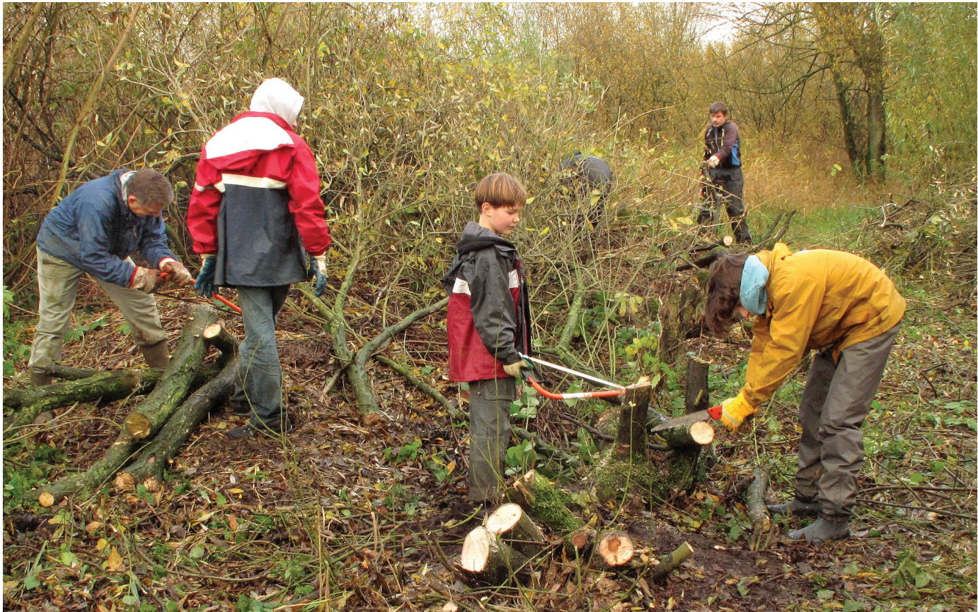
Steeds meer burgers zetten zich in voor beheer en behoud van groen