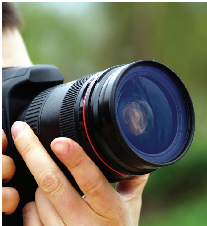
Onderzoek kijkt door verschillende lenzen naar vermaatschappelijking