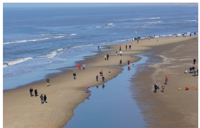
Nederlandse natuurgebieden worden druk bezocht

expliciet, in brede zin te maken hebben met de vermaatschappelijking van natuur. Daarbij hebben wij vermaatschappelijking geïnterpreteerd als 'een beweging waarbij burgers, bedrijven en maatschappelijke organisaties meer initiatief nemen, participeren in, en/of mede verantwoordelijk worden gemaakt voor de realisatie van publieke waarden op het gebied van natuur' (Kunselor en Van Broekhoven, 2018). Er zijn studies verzameld die zijn ingezet om de kennis te vergroten voor: a) de