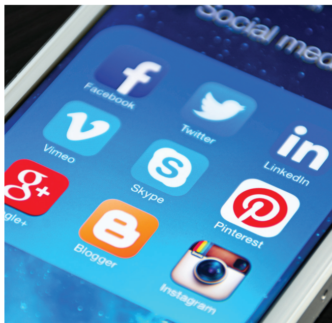
Beeldvorming over de natuur vindt de laatste jaren vaak online plaats

Met de omgevingswet zullen er ook meer verplichtingen komen om omwonenden bij ruimtelijke plannen te betrekken, en wat dit precies voor de natuur gaat betekenen valt nog te bezien. De spanning tussen diverse ruimteclaims en de belangen van verschillende actoren zal ongetwijfeld nog tot nieuwe onderzoeksvragen leiden wanneer de belangen van de natuur raken aan en soms ook conflicteren met belangen in andere sectoren. Hierbij kan bijvoorbeeld gedacht worden aan de ruimte die nodig is voor de bouw van honderdduizenden nieuwe woningen (Ollongren, 2018). Dit legt druk op de aanwezige groene ruimte rondom steden, maar kan ook kansen bieden voor nieuwe combinaties waarbij groene waarden worden gecombineerd met wonen en werken.