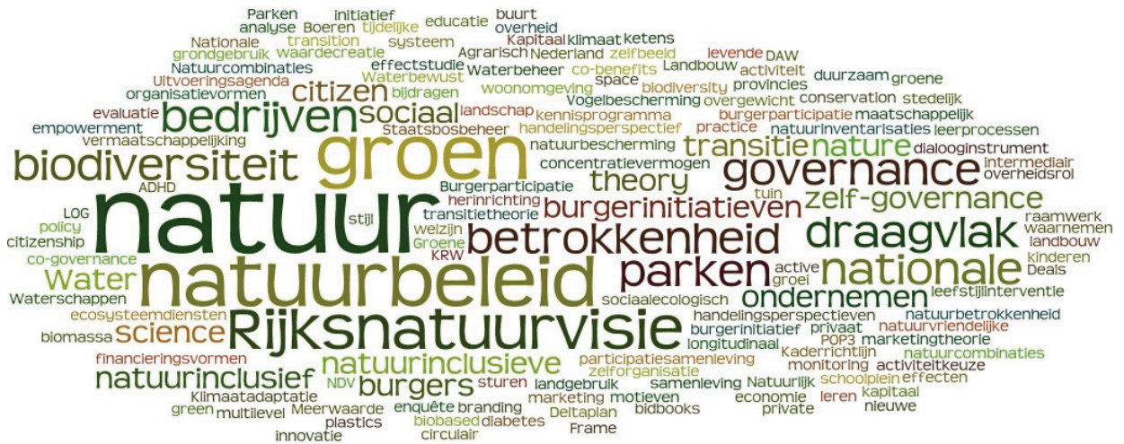
Figuur 1 Overzicht van meest gebruikte trefwoorden in de geïnventariseerde studies.

zonder precies te verklaren wat hieronder wordt verstaan. Wel zijn er veel inhoudelijk gerelateerde thema's en terminologie om vermaatschappelijking van natuur betekenis te geven of af te bakenen (Tabel 1). Voor een breder beeld op de inhoud van de studies is ook gekeken naar de trefwoorden in publicaties. De Wordcloud in figuur 1 laat zien wat de meeste gebruikte trefwoorden zijn en biedt daarmee ook beeld van belangrijke onderwerpen rondom de vermaatschappelijking van natuur.