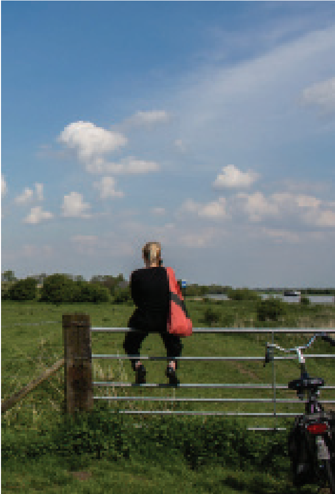
In het onderzoek is weinig aandacht voor sociaaleconomische vraagstukken rond vermaatschappelijking

laat zien dat er veel initiatieven en activiteiten vanuit maatschappelijke actoren zijn. Overheden spelen hier op in met hun beleid en ontwikkelen nieuwe instrumenten om deze betrokkenheid te sturen en te faciliteren. De grote diversiteit aan vormen van maatschappelijke betrokkenheid die het onderzoek laat zien sluit niet goed aan bij generiek beleid voor maatschappelijke actoren. Daarom wordt het belang van maatwerk en passende sturing vanuit de overheid sterk benadrukt in diverse studies die wij hebben geïnventariseerd.