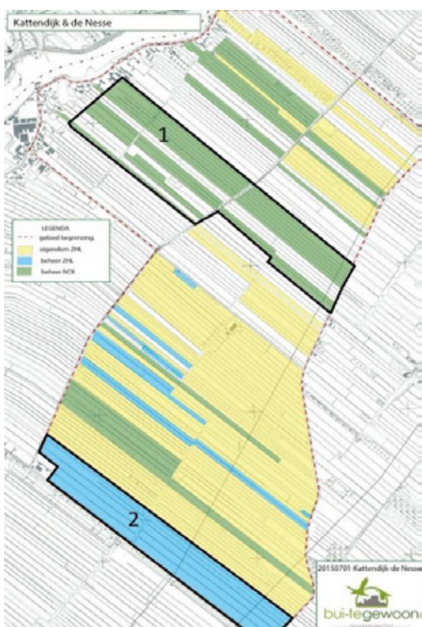
Figuur 1 Gebieden waarvan m.b.v. Waarneming.nl het aantal waarnemingen van weidevogels is vastgesteld in de periode 2013-2018.