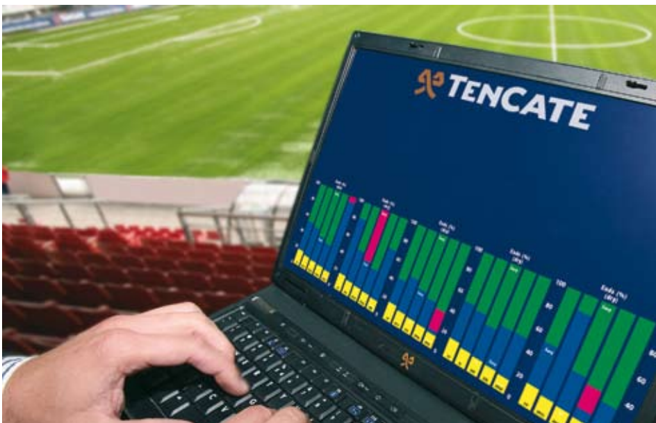
Online uitlezen van veldbelasting

team heeft ervoor gezorgd dat er een technisch zeer geavanceerd veld is neergelegd, dat exact aan de wensen van de Heracles spelers is aangepast.