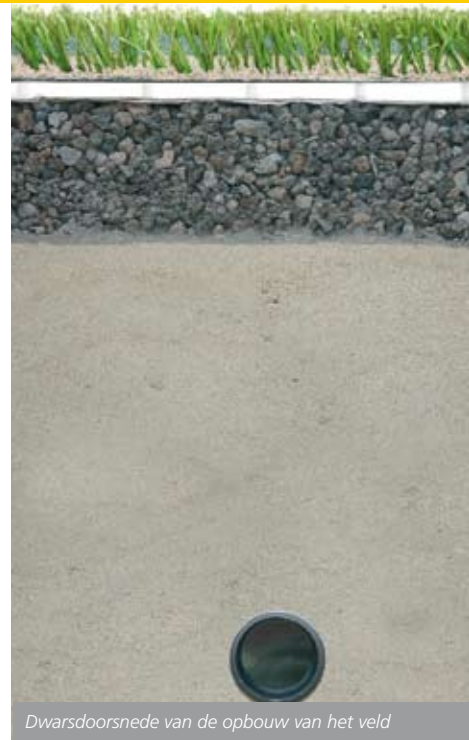
Dwarsdoorsnede van de opbouw van het veld