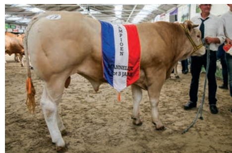
Nero Malo (v. Gaillard), kampioen mannelijk van één tot twee jaar: