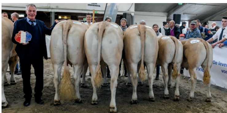
Hoeve Druivendaal, winnaar bedrijfspgroepen