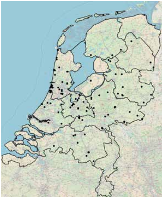
De algemene libellenroutes.

Voor het meetnet libellen zijn we altijd op zoek naar nieuwe tellers. Zoals u op het kaartje kunt zien, zijn de algemene libellenroutes nogal onevenredig verdeeld over Nederland. In Zeeland, Limburg, Groningen, Friesland, Drenthe en Flevoland hebben we nog geen of heel weinig algemene libellenroutes. Voor een betrouwbare trendberekening is een goede spreiding van de routes over Nederland juist heel belangrijk. U bent dan ook van harte welkom om een gat in te vullen!