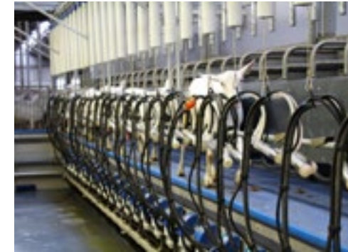
De melkstal is een 2x 45-stands rapid exit.