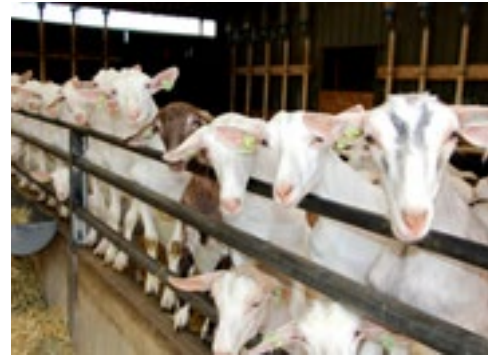
Het jongvee omvat ruim 500 stuks.