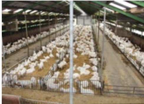
De familie wil groeien naar uiteindelijk 1.200 melkgeiten.