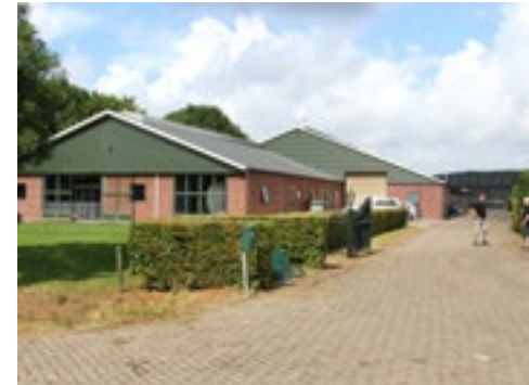
Op termijn wordt er weer uitgebreid, dan zullen de geiten meer ruimte krijgen.