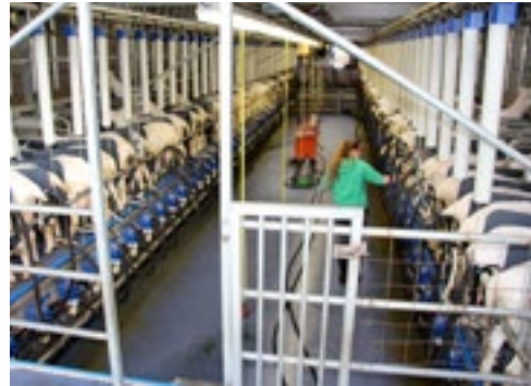
10 uur per dag in de melkput was geen optie meer; er kwam een nieuwe melkstal.