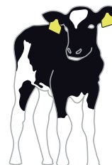
DEEL 3 GROEPSHOKKEN