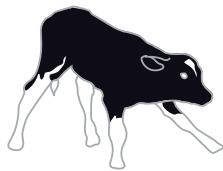
DEEL 1 GEBORTE

Een blauwdruk helpt veehouders om planmatig aan de slag te gaan met het verbeteren van de jongveeopfok. In een serie artikelen lichten specialisten, studenten en veehouders de hoofdlijnen van de checklist per levensfase toe. Dit introverhaal schetst de achtergronden.