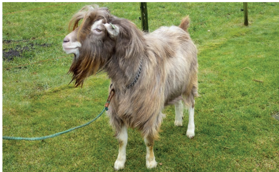
Dekbok Gigant, geboren op 22-02-2016

Ruim honderd jaar geleden is het ras ontstaan door het kruisen van de aanwezige landgeit met de geïmporteerde Zwitserse Toggenburger. Gekozen werd voor het type en de compacte bouw van de land-