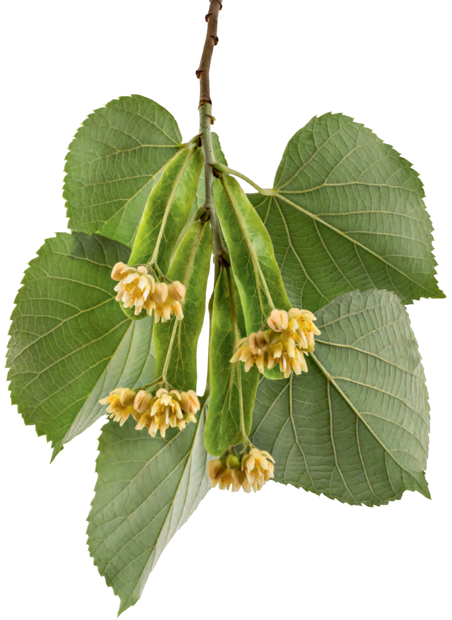
Grootbladige linde of zomertinde ( Tilia platyphyllos ).

De nectar die verschillende bloemsoorten produceren, verschilt niet alleen in samenstelling, maar ook in suikerconcentratie. Bij een keuze-mogelijkheid blijken honingbijen sterk geïnteresseerd in nectar met een hoge suikerconcentratie. Dit lijkt logisch want dat betekent dat er minder vocht verdampt hoeft te worden en er minder vluchten nodig zijn om een raat te vullen. Het gaat dan over de periode tot ongeveer eind juni, waarin er volop dracht is en de bijen ruime keus hebben. Wanneer de dracht schaars is zal iedere bloem die nectar geeft worden opgezocht. Bloemen met nectar met een hoog suikergehalte hebben vaak een lagere nectarproductie dan die met een laag suikergehalte. Bij veel onderzochte bloemsoorten is de nectarafscheiding in de ochtend hoog, neemt daarna geleidelijk af om tegen de avond weer toe te nemen.