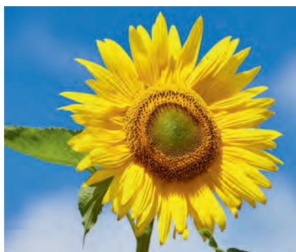
Zonnebloem ( Helianthus annuus ).