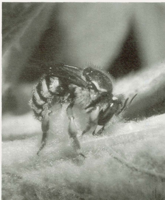
Als een mannelijke grote wolbij ergens een geschikt aantal bloemplanten of behaarde planten heeft gevonden, dan neemt hij ze op in zijn jachtgebied en probeert elke concurrent te verdrijven.

Grote wolbijen zijn echte cultuurvolgers. Ze worden in ons land niet meer in de vrije natuur aangetroffen, maar kunnen zich in een flink deel van ons land handhaven in tuinen. De vrouwelijke dieren zien er in kleurstelling hetzelfde uit als de mannelijke dieren, maar hebben veel minder van de opvallende witte haren. Ze vliegen bij voorkeur op rose gekleurde lipbloemen als hartegesperan ( Leonurus cardinaca ),