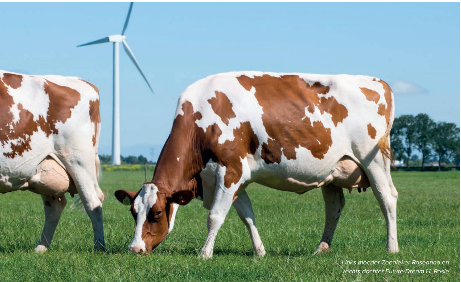
Links moeder Zeedieker Roseanna en rechts dochter Future Dream H. Rosie