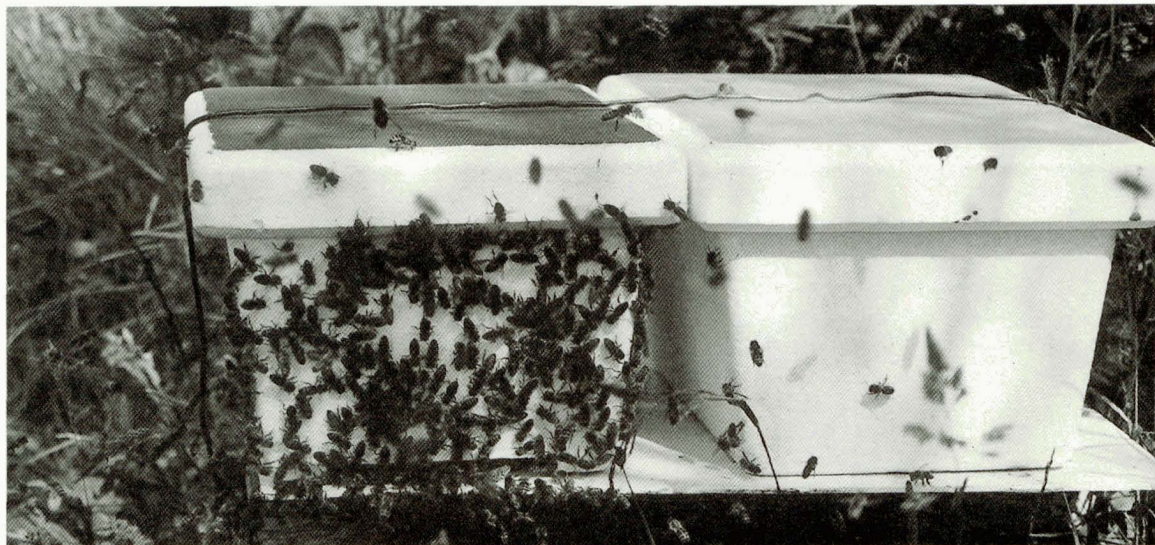
Bevruchtungskastjes op Schiermonnikoog

'En daar kwam ze!', schrijft Jaap, ze werd 'hevig tegenstribbelend naar buiten gedragen' en als ze ontsnapt was aan de greep van de bijen, 'opnieuw gegrepen en weggedragen richting uitgang'. Deze tussen aanhalingstekens geplaatste gedeelten vragen om een apart commentaar. Maar eerst het feit zelf. Wie over een observatiekast beschikt, en over voldoende tijd om er bij te blijven, kan zien hoe het zwermen in gang wordt gezet. Terwijl het grootste