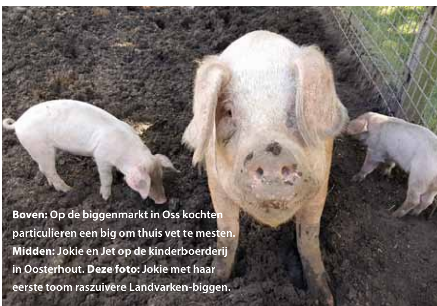
Boven: Op de biggenmarkt in Oss kochten particulieren een big om thuis vet te mesten. Midden: Jokie en Jet op de kinderboerderij in Oosterhout. Deze foto: Jokie met haar eerste toom raszuivere Landvarken-biggen.