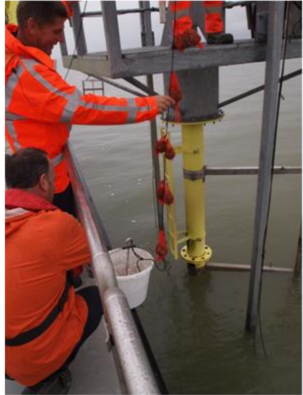
Figuur 2 Voorbeelden van het uithangen van de mosselen. Bevestiging van de mosselen aan het koord (links) met schakels als gewichten, uithangen van een koord aan een meetpaal met een cementanker om het koord strak te houden (rechts).

Per locatie zijn 12-15 netjes met Quaggamosselen uitgehangen, wat neerkomt op 3,6-4,5 kg bruto mosselen. De netjes met Quaggamosselen zijn in de periode van 10-12 oktober 2017 op de diverse locaties uitgehangen. Deze najaarsperiode is bewust gekozen, omdat de paaiperiode (productie en afzetten van ei- en zaadcellen: gametogenese) dan is afgelopen en de overlast (storm, ijsgang) van herfst en winter nog gering is. De netjes zijn in de periode van 20 november tot 23 november weer opgehaald. De accumulatie duur wisselde van 42 dagen voor Maas Eijsden, Ketelmeer en Hollands Diep tot 44 dagen voor Hollandse IJssel (Tabel 2). Een aantal netjes met mosselen is niet uitgehangen, maar op 10 oktober in de vriezer opgeslagen om de uitgangssituatie (IJsselmeer-Zeughoek), inclusief verblijf in het doorstroomaquarium, vast te leggen.