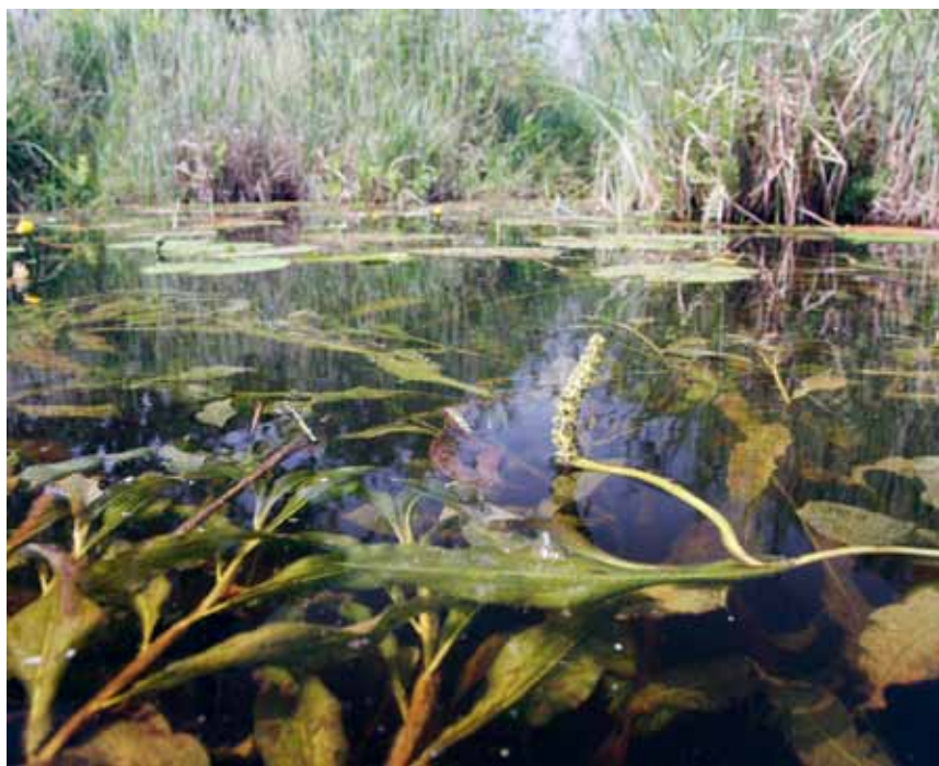
glanzig fonteinkruid Weerribben.