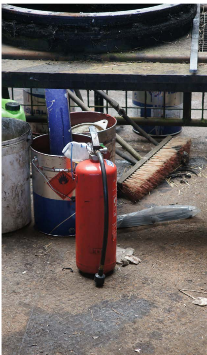
Eén van de bijzondere eisen is dat er brandblusapparatuur moet zijn. Terwijl er toch voldoende water vlak bij de hand is.

Als het oude materieel niet vóór 1 november 2018 bij een keuringsinstantie is aangemeld, is de overgangsbepaling niet van toepassing en geldt ESTRIN 2017(1) en bijlage 13.12 bij de Binnenvaartregeling. Die eisen zijn zwaarder, duurder en soms voor oud materieel lastig of niet toepasbaar.