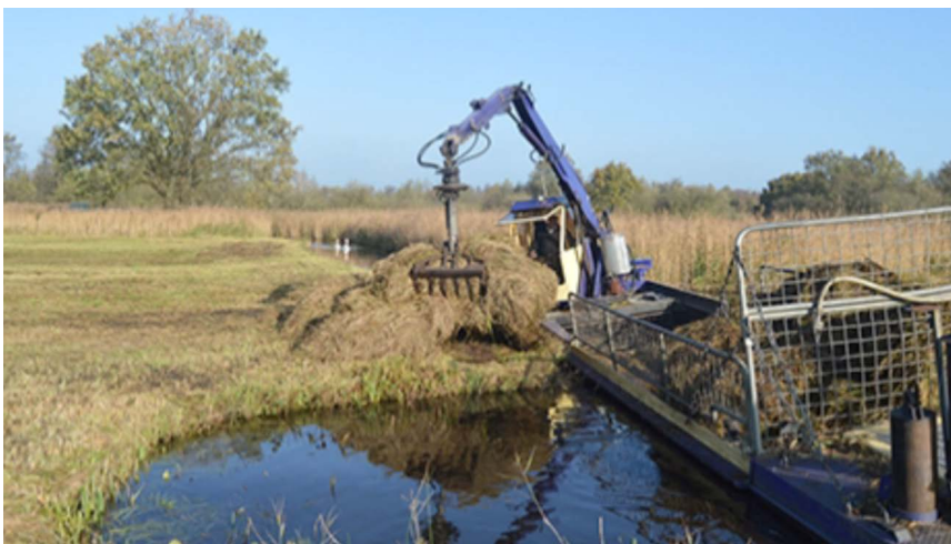
De nieuwe regeling betekent dat alle drijvende werktuigen die op water dat in open verbinding staat met meren, kanalen en rivieren komen, moeten worden gekeurd.