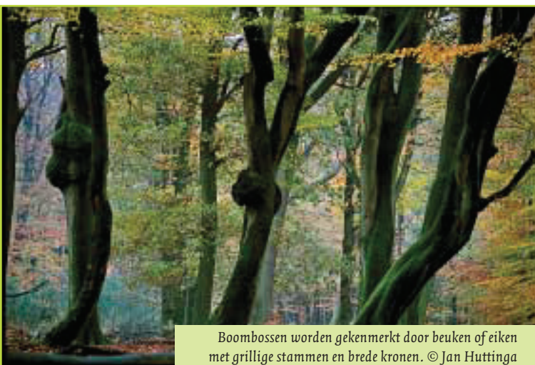
Boombossen worden gekenmerkt door beuken of eiken met grillige stammen en brede kronen.

Indien u nog nooit heeft gehoord van bijenschansen, tochten, pestbosjes en schapenkampen, dan heeft het boek 'Historische boselementen' u iets te bieden. Als wij heden ten dage bomen planten ter gelegenheid van een bijzondere gebeurtenis, of ter markering van een bijzondere plaats, dan is de kans groot dat vele generaties na ons nog van deze bomen zullen genieten, maar niet meer weten waarom deze