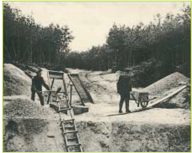
Grindwinnen laat z'n sporen na.

ooit zijn aangeplant. Zo kunnen we ook in de bossen van de Lage landen, als we dat leren te zien, talloze bedoelde en onbedoelde sporen ontdekken van de werkzaamheden of activiteiten van onze voorouders. Deze erfenis is ongekend. Haast overal kun je ervaren dat de mens de hand in onze bossen heeft gehad. Zoekend naar water, bezig met de verfraaiing van zijn omgeving of zijn akkers verdedigend tegen wildvraat, het zit allemaal in het geheugen van het bos gegrift. Het boek laat u daarvan iets zien. Het voert u mee langs een aantal wat minder bekende cultuurhistorische elementen in het landschap en geeft informatie over de geschiedenis en over de wijze waarop deze elementen behouden kunnen worden. Maar het is er vooral op gericht om de belangstelling en waardering voor deze elementen te vergroten en daarmee een bijdrage te leveren aan het behoud van het rijke culturele erfgoed dat in onze bossen verborgen ligt. ■