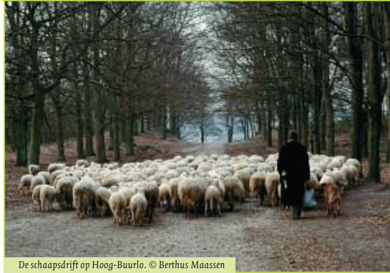
De schaapsdrijft op Hoog-Buurlo.