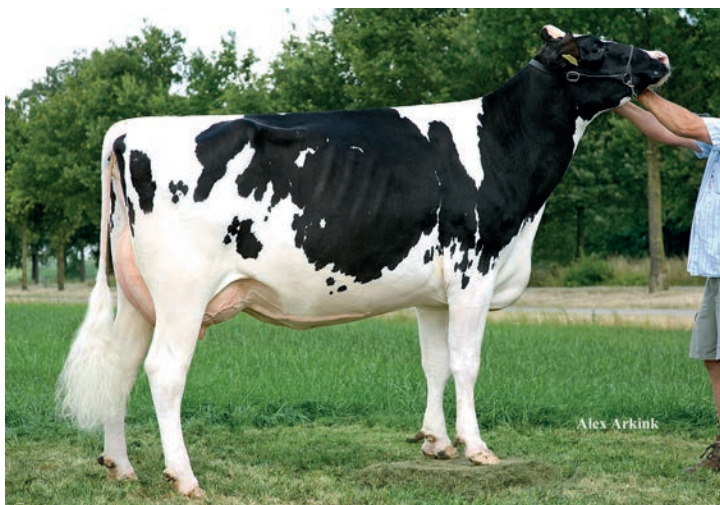
Delta Rainbow (v. G Force), 85 punten. Productie: 2.06 10.401 4,23 3,49