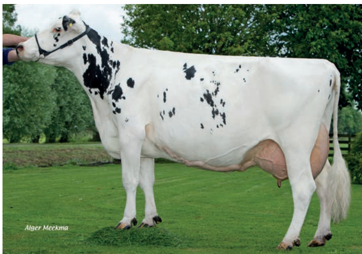
Delta Jacoline (v. Shottle), 87 punten. Productie: 2.05 9634 4,60 3,41