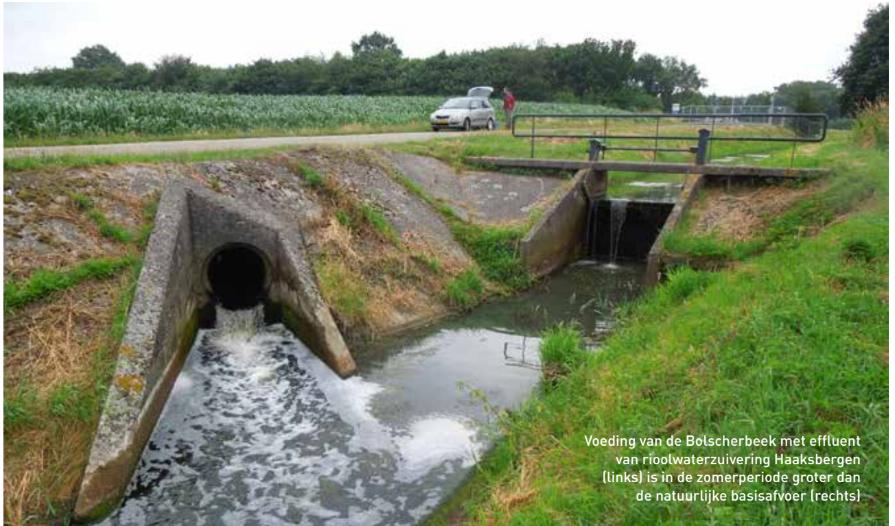
Voeding van de Bolscherbeek met effluent van rioolwaterzuivering Haaksbergen (links) is in de zomerperiode groter dan de natuurlijke basisafvoer (rechts)