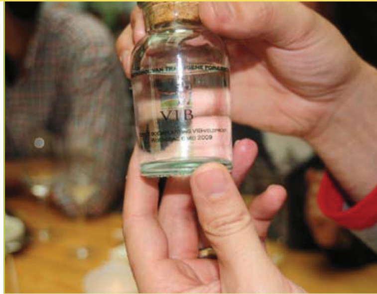
Figuur 3: Bio-ethanol afkomstig van transgene populieren.

Aangezien men nu reeds in grote hoeveelheden ethanol produceert, zijn de hindernissen hier beperkt. Indien ethanol in beperkte hoeveelheden (bv. 5% van het volume) vermengd wordt met benzine, is er immers geen aanpassing van de motor nodig; als het ethanolaandeel verder zou stijgen dan moeten de motoren wel aangepast worden. Deze aangepaste motor bestaat echter al: onder meer in Zweden rijden wagens rond op mengsels die tussen de 0 en 85% ethanol bevatten ( flexi-fuel vehicles ).