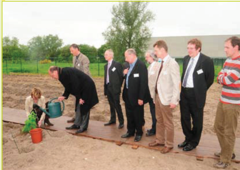
Figuur 1: Aanplant van de eerste genetisch gewijzigde populier door Vlaams Minister Patricia Ceysens in het Technologiepark te Zwijnaarde.