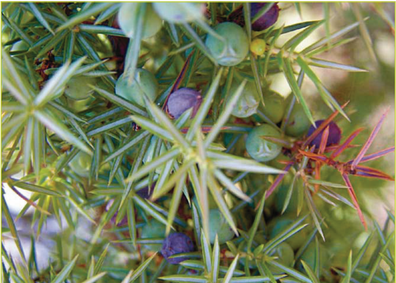
Figuur 4: Groene (één- en tweejarige) en blauwe (driejarige) bessen