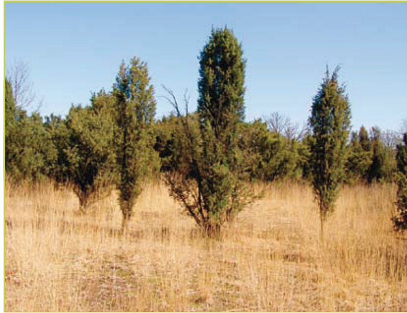
Figuur 2: Jeneverbesstruweel, Heiderbos te As

Jeneverbes ( Juniperus communis ) is, naast taxus ( Taxus baccata ) en mogelijks grove den ( Pinus sylvestris ) de enige inheemse naaldboomsoort in Vlaanderen. Het is een wintergroene, lichtminnende naaldboomsoort van de cipresfamilie. Jeneverbes is een pionier en heeft een groot verspreidingsgebied (het grootste van alle naaldboomsoorten) in koude en gematigde streken van heel het noordelijk halfrond (Weeda et al. 1985). De struiken worden ongeveer 100 jaar oud, bloeien in de lente vanaf het tiende levensjaar en zijn tweehuizig; er zijn dus mannelijke en vrouwelijke struiken. Vrouwelijke struiken worden via de wind bestoven en zaden worden vooral door vogels verbreid. De meeste zaden vallen echter gewoon onder de moederboom. Jeneverbes heeft een complexe kegel- en zaadontwikkelingsbiologie. Het zaad rijpt over twee tot drie jaar. De vrouwelijke kegels vormen blauwe schijnbessen die één tot vijf, maar meestal drie zaden bevatten. Het zaad heeft een lange kiemrust