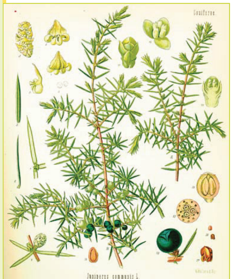
Figuur 1: Morfologische kenmerken van de jeneverbes. 1 = mannelijke bloesem, 2+3 = meeldraden, 4 = vrouwelijke kegel, 5 = idem in overlangse doorsnede, met zaadknop, 6 = rijpe kegel, 7 = doorgesneden kegel met 3 zaden met talrijke harsreservoirs, 8+9 = longitudinale doorsnede zaad, A = mannelijke bloesemtak, B = vrouwelijke bloesemtak. Gedeeltelijk vergroot (Thomé, 1885).

AN VANDEN BROECK (INBO), ROBERT GRUWEZ (UGent, Labo voor Bosbouw) & KRIS VERHEYEN (UGent, Labo voor Bosbouw)