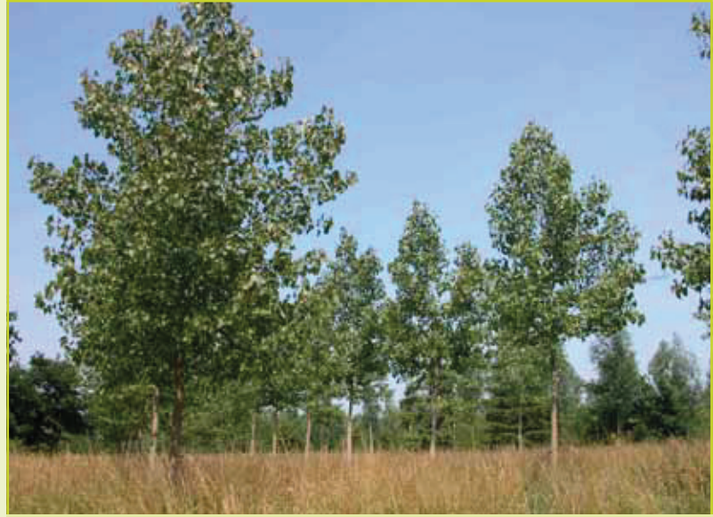
Figuur 1: Jonge aanplanting van Canadapopulier.

Gelukkig is de Canadapopulier, zoals veelal het geval is bij eerste generatie-hybriden (of F 1 -hybriden), steriel waardoor zijn expansiecapaciteit beperkt blijft. Indien dat niet