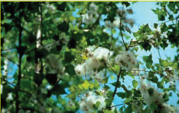
Figuur 2: Zwarte populier in zaad.

lijke Maas worden ingrepen uitgevoerd aan het rivierbed om de natuurwaarde te herstellen en problematische hoogwaterstanden te vermijden. Bij het wegwerken van dijken ontstaan vochtige, onbegroeiende oevers die uiterst geschikte kiemplaatsen vormen voor populier. Op deze plaatsen wordt regelmatig jonge kiemplanten van populier waargenomen. Uit genetische onderzoek blijkt dat deze spontaan gekiemde populieren afkomstig zijn van cultuurpopulieren: voornamelijk van West-Amerikaanse balsempopulieren maar ook van Canadapopulieren. Dit laatste is opmerkelijk; de steriele Canadapopulieren lijken zich toch succesvol voort te planten via zaden. Om deze tegenstrijdigheid verder uit te klaren, werden kruisingsexperimenten opgezet aan het Instituut voor Natuur- en Bosonderzoek (INBO).