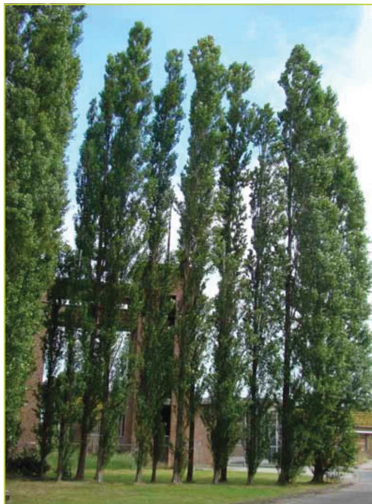
Figuur 3: Italiaanse kaarspopulier.

De resultaten van de kruisingsexperimenten bevestigden dat de Canadapopulier inderdaad steriel is. Een kruising van twee Canadapopulieren onderling, levert over het algemeen geen zaden. In enkele gevallen worden toch enkele zaden geproduceerd, maar deze zijn zelden kiemkrachtig. De Canadapopulier produceert ook over het algemeen weinig eigen stuifmeel en het stuifmeel dat toch wordt geproduceerd, heeft een lage vitaliteit.