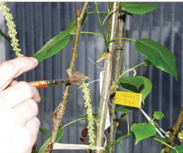
Figuur 5: Gecontroleerde, kunstmatige kruisingen bij populier uitgevoerd in de serre.

Het gebruik van soortvreemd stuifmeel voor het doorbreken van voortplantingsbarrières is een gekende techniek in veredelingsprogramma's van plantengewassen. Het