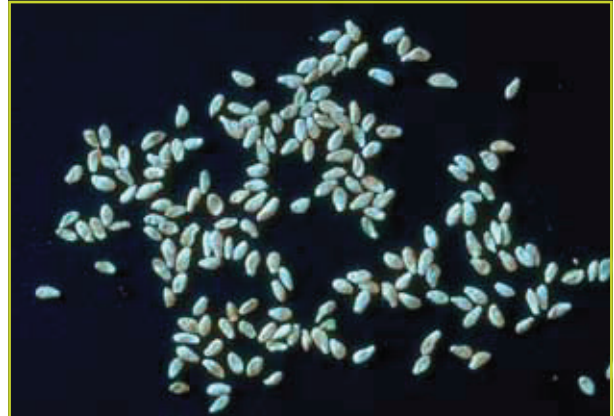
Figuur 6: Zaden van populier.

wordt gebruikt bij Citrusplanten en de tabaksplant om zelfbestuiving mogelijk te maken. De bevindingen uit dit onderzoek komen voort uit serre-experimenten maar er zijn aanwijzingen uit vorige studies dat een gelijkaardig fenomeen zich mogelijk ook in het veld voordoet.