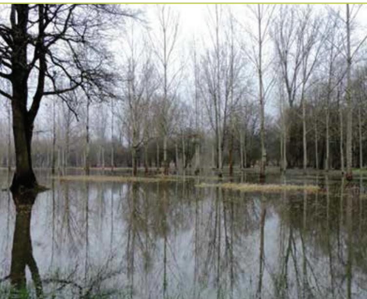
Figuur 1: Winteroverstromingen zullen vaker voorkomen, vooral in de riviervalleien waar veel populierenaanplanten voorkomen © Beatrijs Van der Aa.

Er wordt verwacht dat het aantal droge groeiplaatsen zal stijgen in de toekomst, maar dit zal in Vlaanderen wellicht slechts voor een beperkt aantal boomsoorten problemen geven. Met name beuk, gekend als droogtegevoelig, zou hierdoor volgens sommige bronnen groeivermindering vertonen of zelfs in extremis in het gedrang kunnen komen.