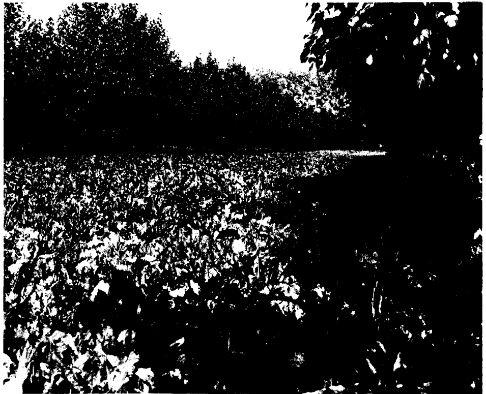
Snelgroeiend hout als onderdeel van een landbouwbedrijf

Vaak worden die gronden al een tijd lang om niet of tege zeer lage vergoedingen uitgegeven in agrarisch gebruik. Een risico daarbij is echter dat er, ongewild, toch een pachtsituatie met een langdurig karakter ontstaat. Bij aanplant van snelgroeiend bos bestaat dat gevaar niet; met een goed plantingsplan kan binnen tien jaar na aan-