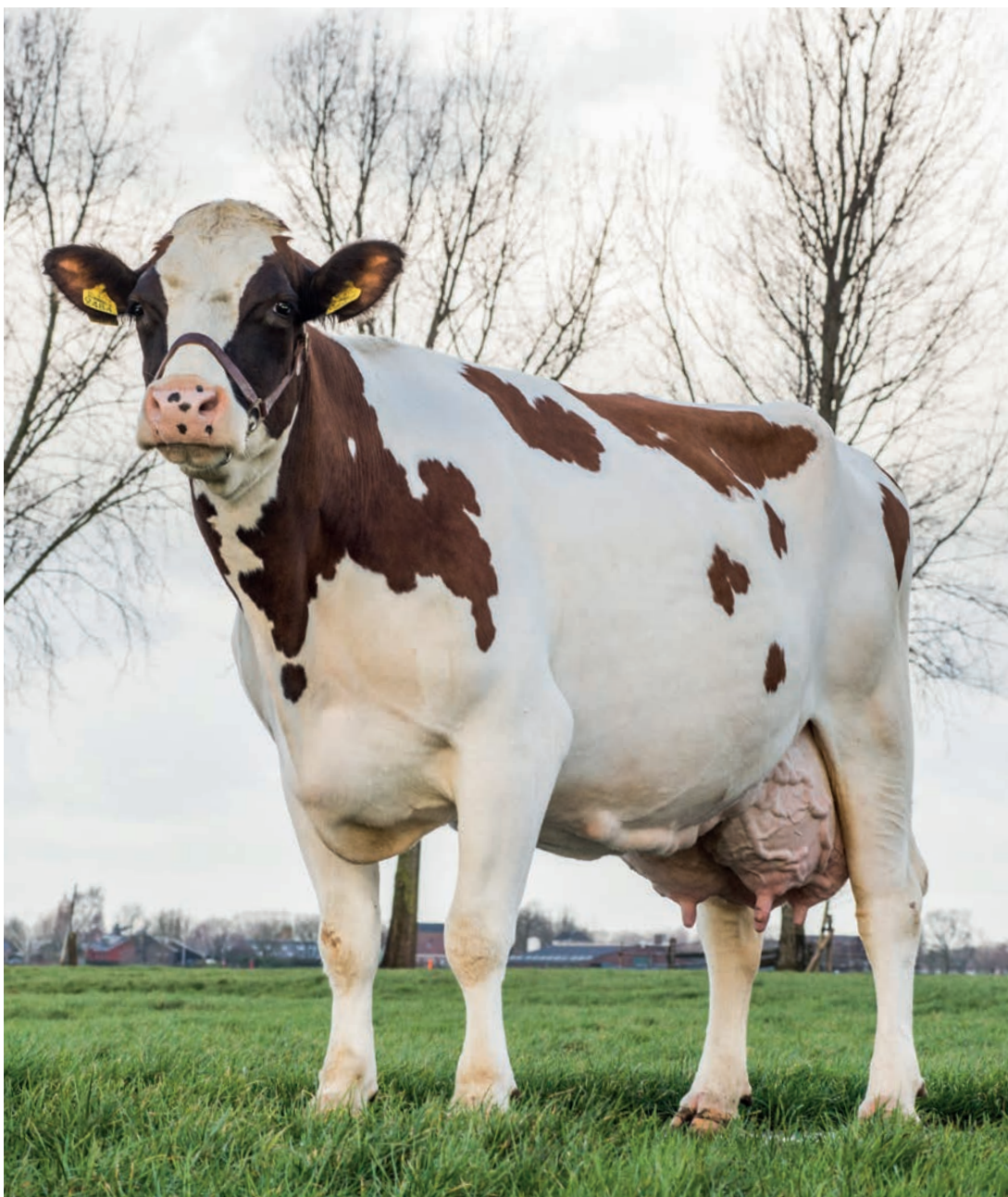
De Vinkenhof Danielle 95 is de eerste mrij-koe in dertig jaar met 92 punten

De zeven jaar oude Danielle is daarbij ook