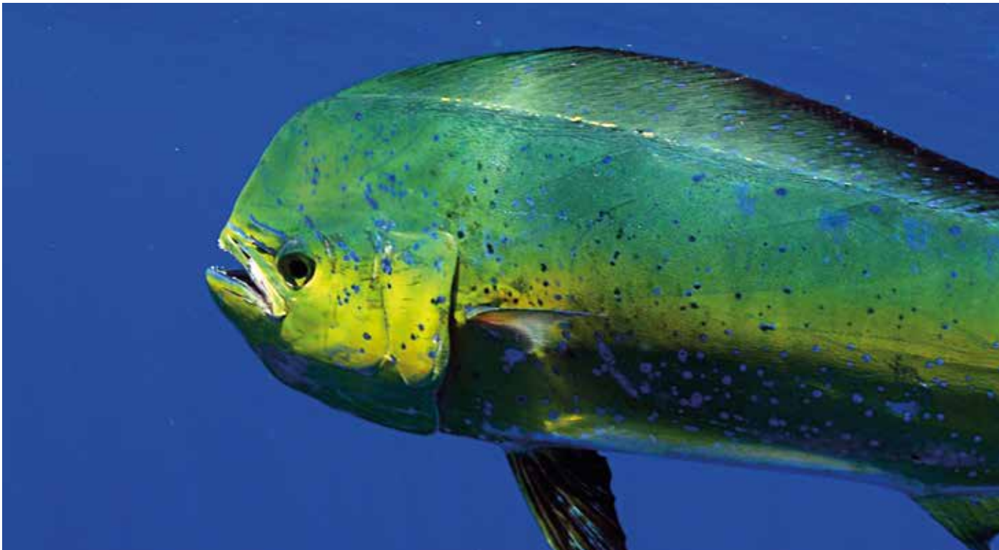
De ogen van een mahi mahi zijn afgestemd op het zien van contrast tijdens zijn horizontale jacht in de bovenste waterlaag.

Er was een tijd – een paar decennia geleden – dat de wetenschap echt ernstig twijfelde over de vraag of vissen kleuren konden zien. Maar simpele experimenten met kleurlampen en voerbeloning toonden dat een eenvoudige goudvis een flink deel van het kleurspectrum waarneemt. Inmiddels is duidelijk dat veel andere soorten niet alleen kleuren prima waarnemen, maar ook ultraviolet en gepolariseerd licht. Verder is de gevoeligheid van het vissenoog bijzonder. Sommige soorten zien vage lichtschijnsels in de diepzee, die zelfs het meest gespecialiseerde nachtdier op land niet zou opmerken. De wetenschap heeft de laatste jaren meer opmerkelijke basiseigenschappen van vissenogen in kaart gebracht. Medici kijken er inmiddels met grote belangstelling naar, vanwege het opmerkelijke vermogen om schade aan het netvlies te herstellen. Als bij mensen en andere zoogdieren het netvlies beschadigd raakt door bijvoorbeeld een bloeding, is dat meestal definitief. Bij vissen groeit het beschadigde deel weer terug.