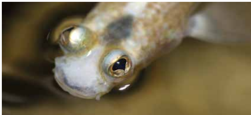
De vieroogvis Anableps anableps heeft een gedeeld netvlies waarmee gelijktijdig boven- en onderwater kan worden gekeken.

weerkaatsen. Snoekbaars is daarvan het meest sprekende voorbeeld in onze streken. Veel haaien beschikken er ook over. De reflectie wordt verzorgd door guaniekristallen die ook in glinsterende vissenschubben zijn te vinden. Onder matige lichtomstandigheden heeft zo'n spiegellaag een flink voordeel, al wordt het zicht er door lichtverstrooiing waarschijnlijk iets minder scherp door. Verder kan het lastig zijn bij een overgang naar felle lichtomstandigheden. Vandaar dat sommige haaien de spiegellaag overdag bedekken met een donker pigment.