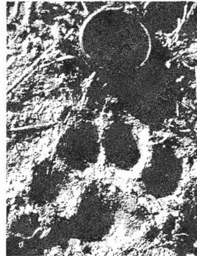
Prent gevonden nabij Epen op 9 maart 1996. De diameter van de lensdop is precies 5 cm. Gezien de grootte van de prent zou het om een mannetjes-lynx kunnen gaan.