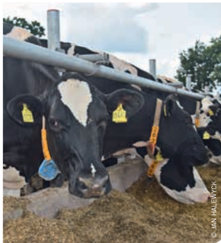
De verschillen in omvang en structuur van de melkveebedrijven in Duitsland zijn groot.

cale dossiers adviseert men zijn leden vooral op het vlak van belastingen en verzekeringen maar minder op het vlak van bedrijfseconomische en -technische opvolging. In Niedersachsen is de melkveesector verder nog gestructureerd in de brancheorganisatie Milchland. Deze is opgericht door de landbouworganisaties, zuivelindustrie en consumentenverenigingen. Zij staat onder meer in voor de verzameling van marktinfo en het voeren van zuivelpromotie. Daarnaast zijn er ook meerdere producentenorganisaties actief.