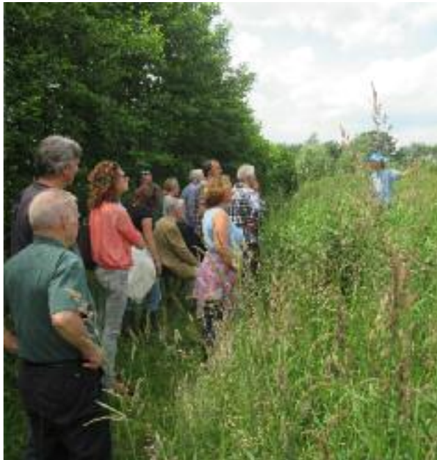
Praktijkbezoek aan voedselbos Ketelbroek