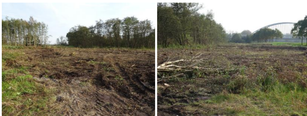
Figuur 6 Situatie op 19-10-2017. Gekapt is 2,2 ha bos in de eendenkooi.

De huidige populatie heikikkers van 1000 tot 1500 dieren (op zijn best net duurzaam, zie sectie 5.2 punt 6) rust op circa 300 ha aaneengesloten gebied. Dit geeft aan dat het huidige habitat een vrij lage draagkracht heeft: bij goed kwaliteit zou deze oppervlakte een meer dan twee keer zo grote populatie moeten kunnen herbergen. Deze oppervlakte wordt in eerste instantie teruggebracht naar 40 ha. Ook al is de beoogde kwaliteitsverbetering van dit kerngebied op tijd gerealiseerd – hetgeen momenteel niet aan de orde is (ter illustratie nieuwe voortplantingswateren zijn tot op heden, anno 8 december 2017, niet gerealiseerd. Evenals dat het gekapte bos in de eendenkooi (Figuur 6), wat overigens onderdeel uitmaakte van het habitat voor de heikikkers, en wat moet worden omgevormd naar veenweidegebied is tot op heden nog lang niet functioneel. Terwijl gelijktijdig delen van het plangebied bouwrijp worden gemaakt!) –, dan nog blijft de afmeting ruim onder de norm van 50 ha voor een sleutelgebied. Samen met verbindingzone A wordt die norm wel gehaald, maar uit de huidige planning wordt niet duidelijk of dit gebied tijdens de inrichtingsfase constant geschikt blijft als habitat. Daarnaast wordt deze verbindingzone doorsneden door niet alleen de ontsluitingsweg, maar ook een langzame verkeersroute (noord-zuid), meerdere fietspaden en een brede vaart van minimaal 25 m breed.