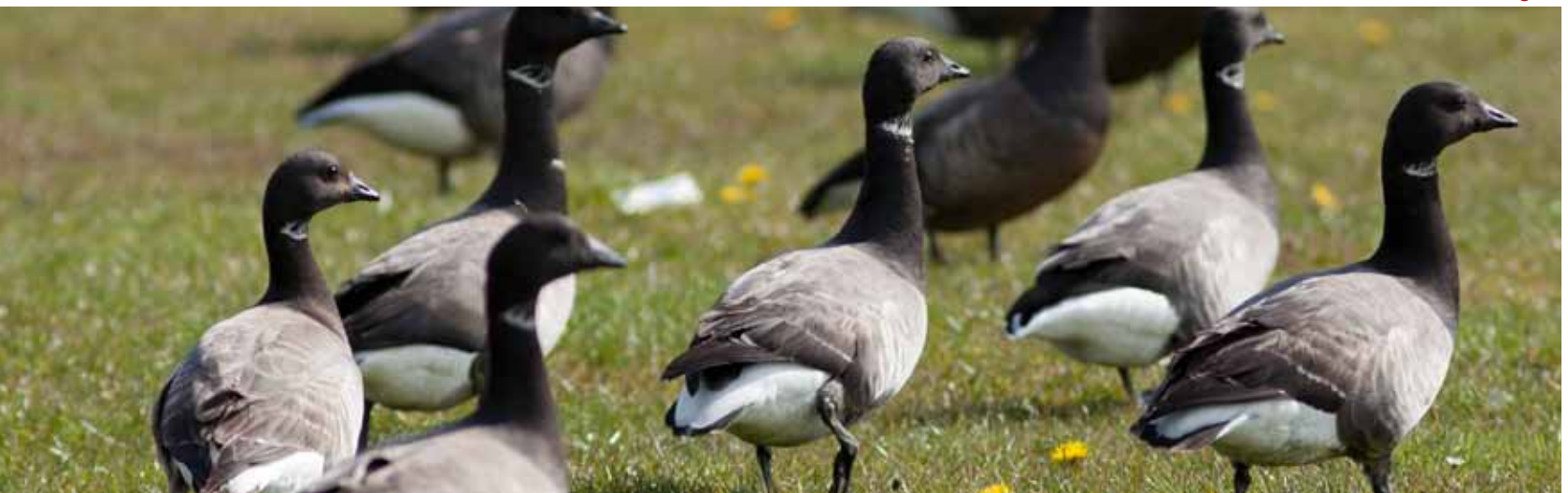
Figuur 1. trends getaxeerde schade grote vier