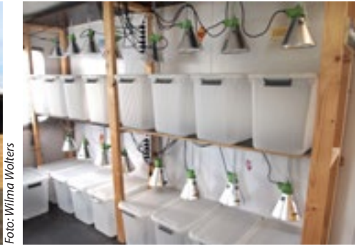
Pasgeboren lammeren krijgen drie keer biest en verblijven dan in deze bakken.