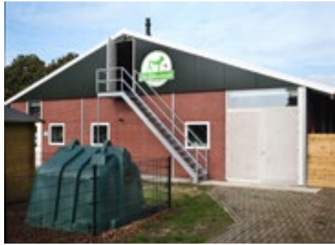
Aan de voorzijde van de stal leidt een trap naar de skybox, die altijd toegankelijk is.