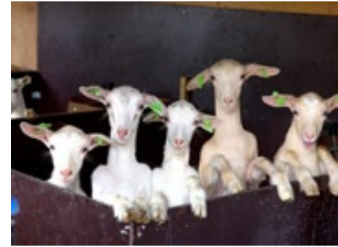
Als de lammeren naar de opfokstal gaan, kunnen ze goed zelfstandig drinken.