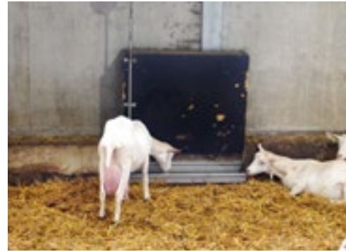
De stal voldoet aan de eisen van de Maatlat Duurzame Veehouderij.