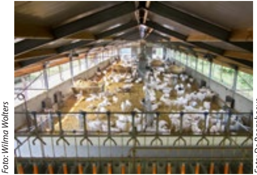
De stal is licht en goed te overzien vanuit de skybox.