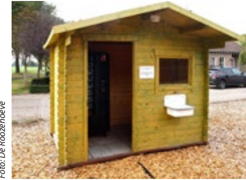
Om 5 cent per liter melk extra te verdienen, staat er op het erf een kaasautomaat.